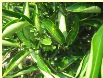
CFコード、醗酵液散布 無し

施工した区画は、かいらぎ病(茶色い斑点状のもの)の発生がなく、虫(カメムシ、アゲハ蝶)の発生も無かった。