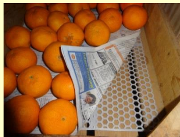
熟成庫のCFネットを敷いたところ、数日でみかんの酸味が消えた。

施工した区画は、かいらぎ病(茶色い斑点状のもの)の発生がなく、虫(カメムシ、アゲハ蝶)の発生も無かった。