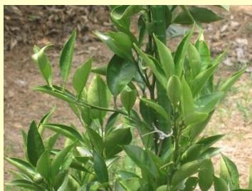
CFコード、醗酵液散布 有り