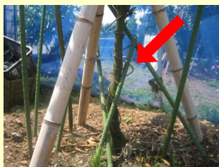
CFコードを幹に巻く